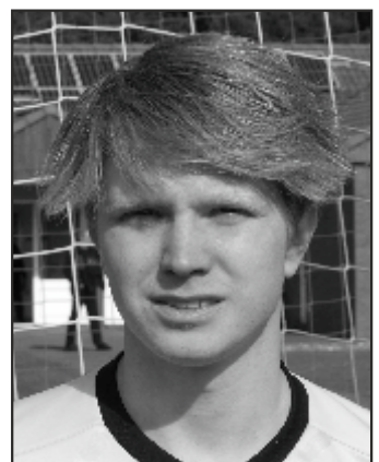
Niklas Kjer Sturm