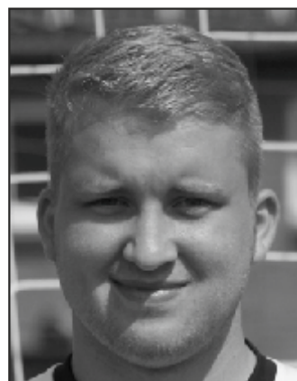
Markus Zemke Sturm